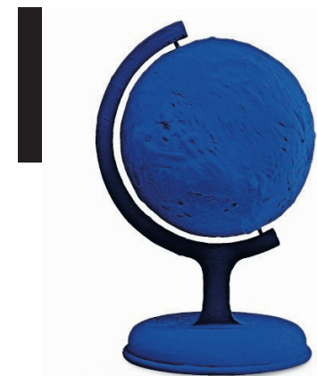
De blauwgeverfde wereldbol van Yves Klein

Voor wie of wat? Dat blijft gissen. Als bezoeker ben je tegelijkertijd wel en niet een onderdeel van het mysterie. Je mag de kapel betreden – één bezoeker tegelijk – en kunt zo ervaren hoe het is om voor even samen te vallen met een kunstwerk, maar erin opgaan lukt niet. Je loopt namelijk niet over de rotsen maar over glazen platen, en ook de wanden en het plafond zijn afgeschermd door glas. Die minimalistische glazen kubus contrasteert mooi met de grillige kleimassa en krioelende patronen. Je stapt binnen in een blauwe wereld én blijft erbuiten.