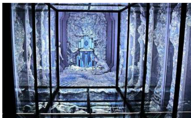
Alles is handgemaakt in de mysterieuze binnenste van het kunstwerk, dat iets van een grot heeft.