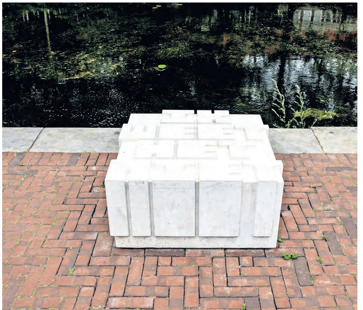
→ Deze hoort natuurlijk bij Nescio, maar van wie is 'Kleur heeft de mens getekend'? FOTO NOSH NEHNEH