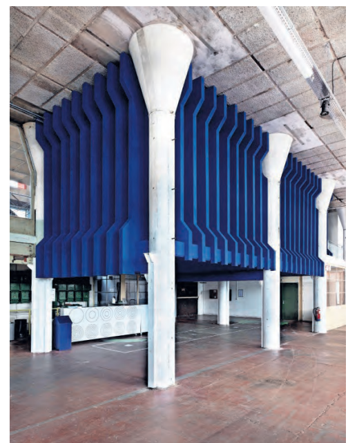
→ Het interieur van Sanctum (boven). De installatie van kunstenaar Levi van Veluw zit ingeklemd tussen de grijze zuilen van het gebouw van Het HEM. FOTO'S LEVI VAN VELUW