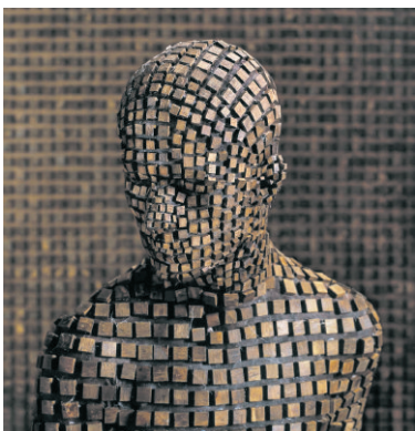
Serie ' Origin of the Beginning ', 2011