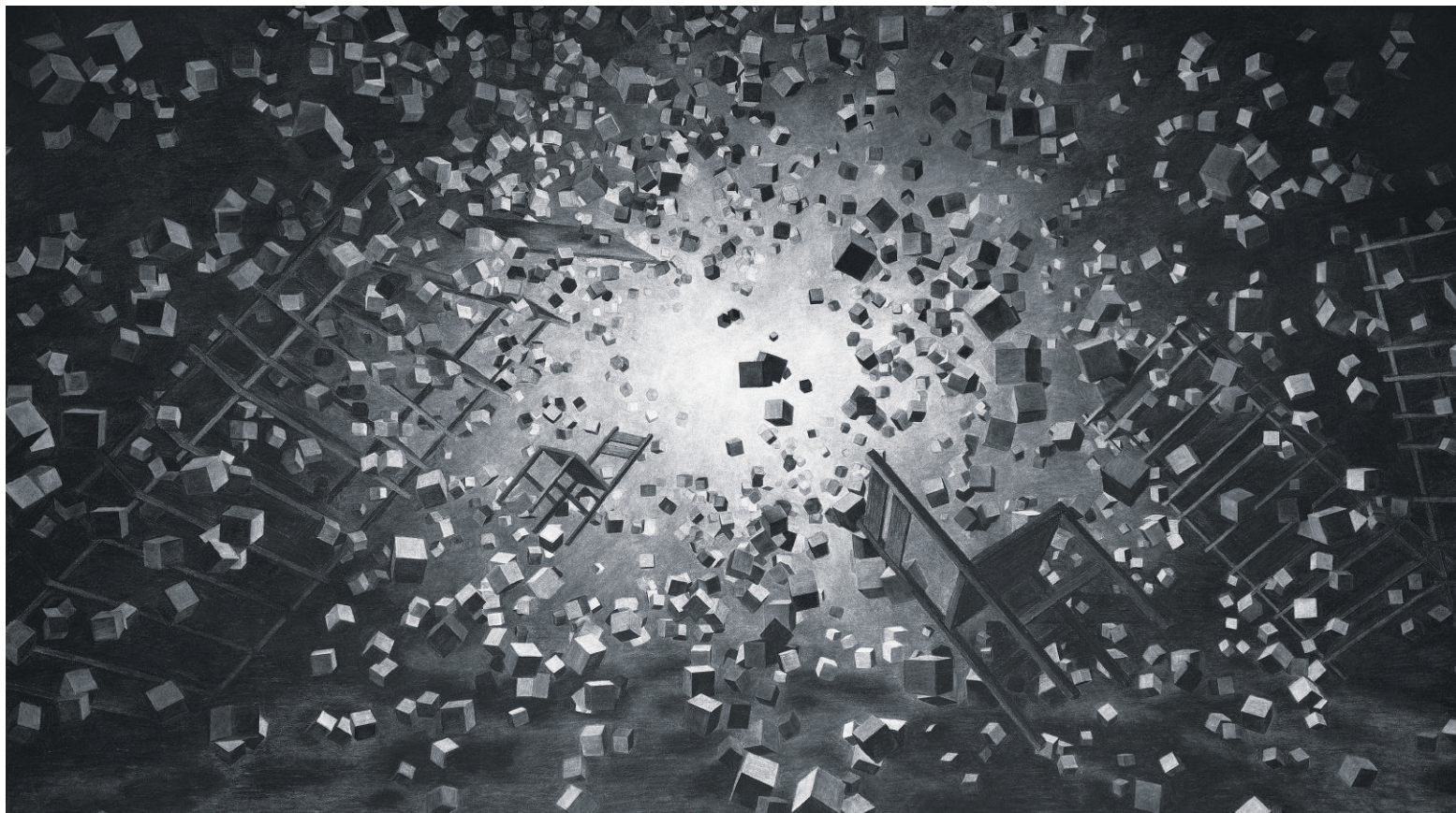
' Implosion ', tekening in houtskool (205 bij 120 cm), 2013 IL-

g g De biografie over Georg Büchner (1813-1837)