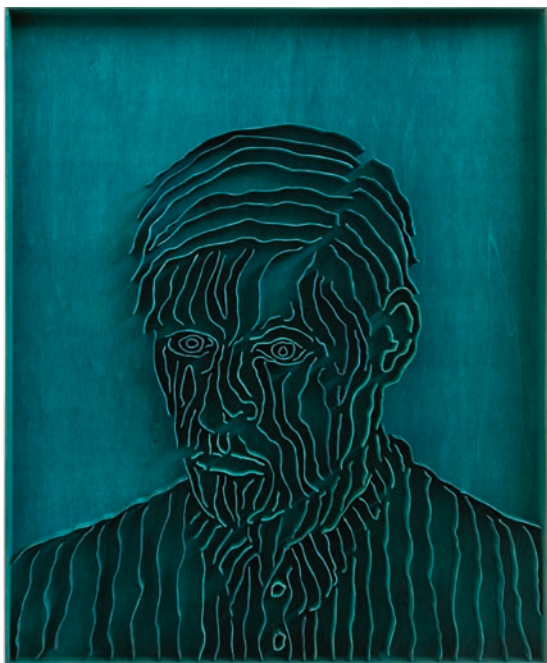
'Insistent' (2023). Op de foto zie je het niet zo goed, maar dit werk heeft ook letterlijk diepte.