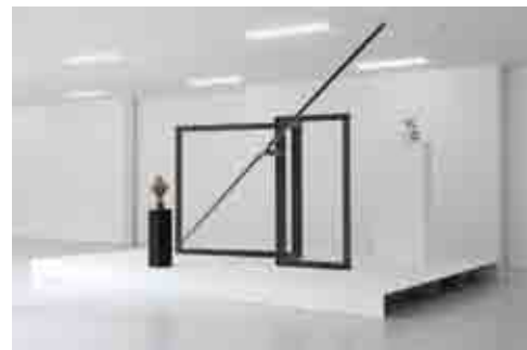
Carol Bove / Carlo Scarpa, installatiezicht Museum Dhondt-Dhaenens, 2015 © Carol Bove/Carlo Scarpa Courtesy of MacCarone, NewYork & David Zwirner, New York/ Londen

Als case study richtte Carol Bove zich op de expo 'Ambiente', Scarpa's bijdrage voor de 34ste Biënnale van Venetië in 1968, waarbij de archi-