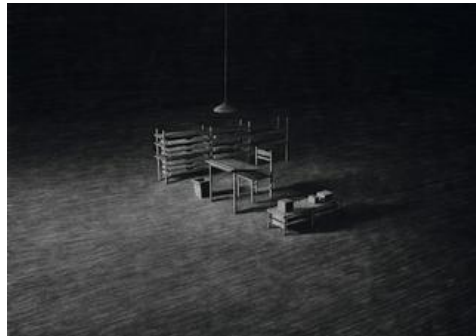
Levi van Veluw, ROOM 1 (2013)