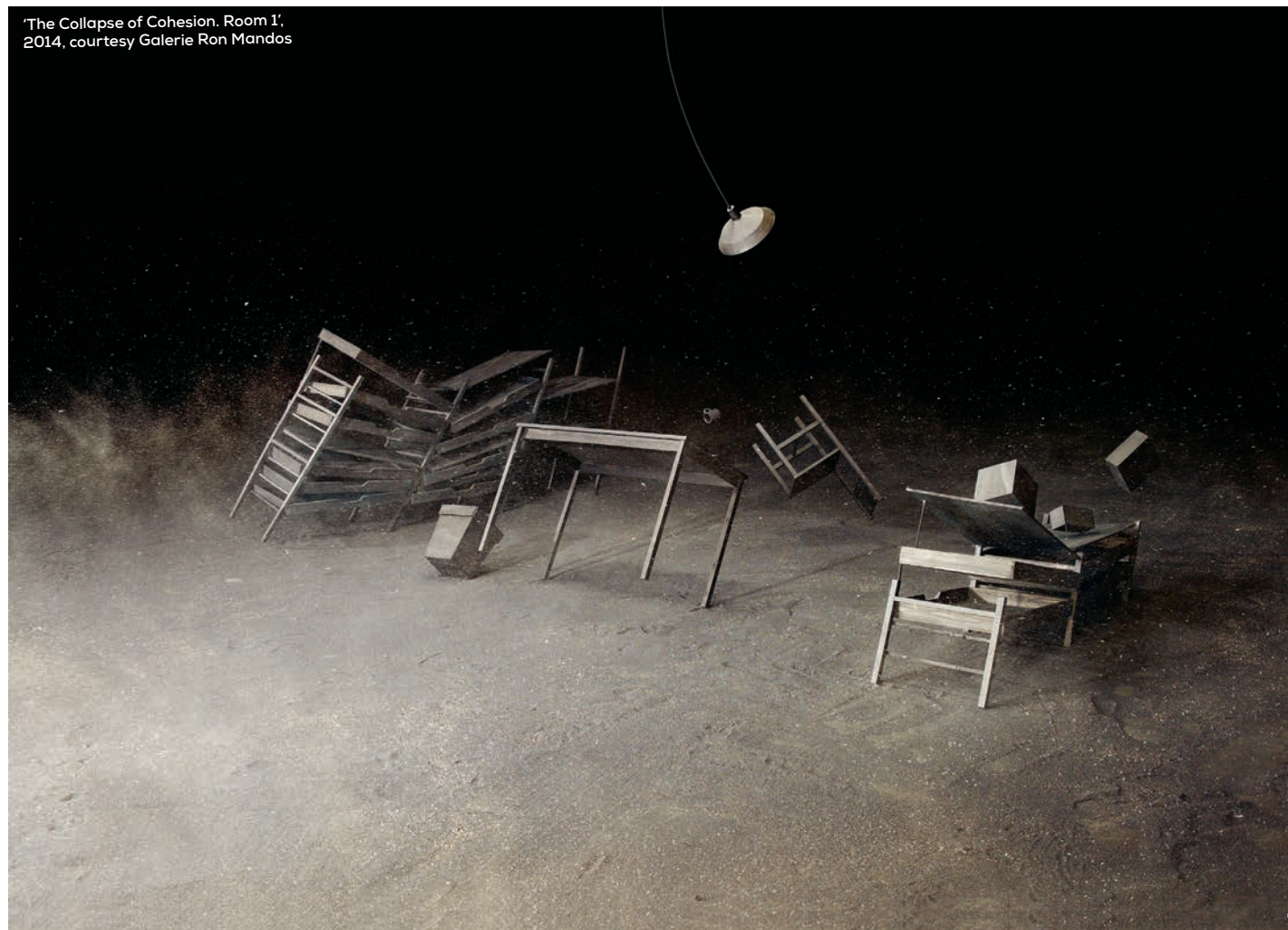
'The Collapse of Cohesion. Room 1', 2014