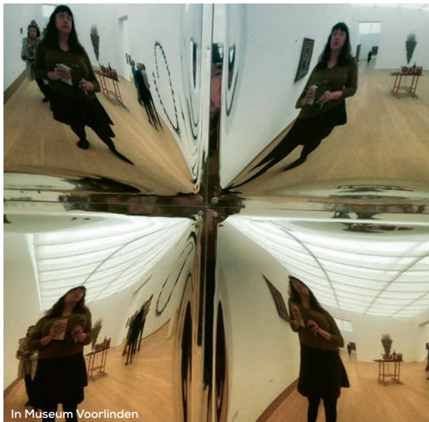
In Museum Voorlinden