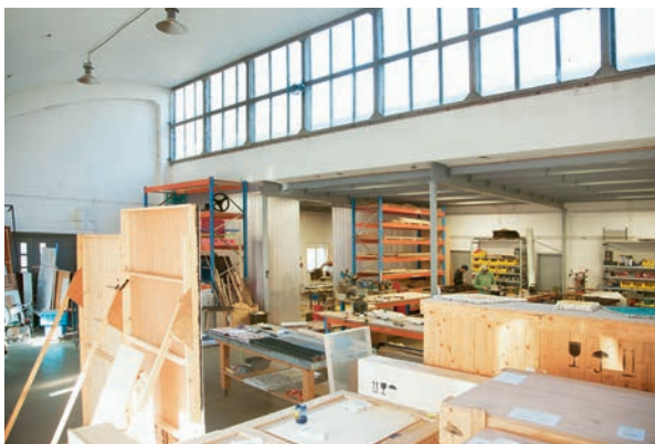
Het atelier van Levi van Veluw, binnen: de werkplaats