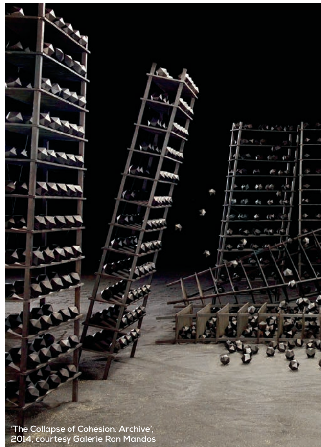
'The Collapse of Cohesion. Archive', 2014, courtesy Galerie Ron Mandos