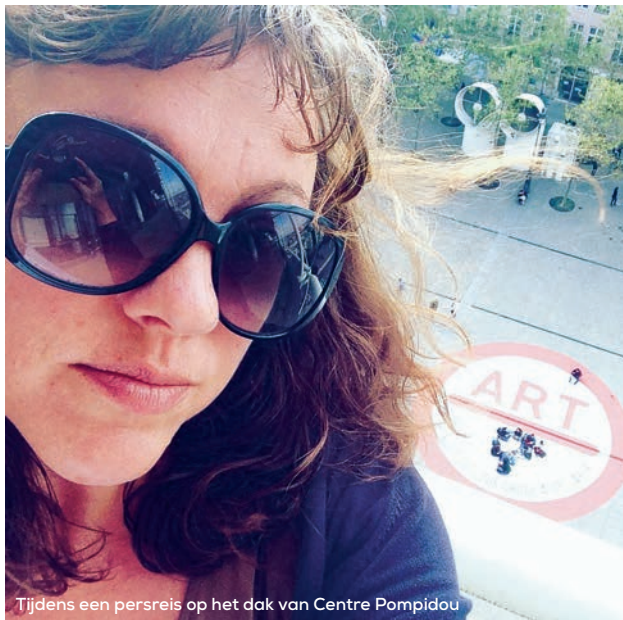
Tijdens een persreis op het dak van Centre Pompidou