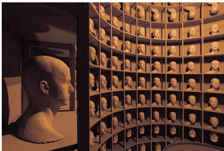
Beeld uit de video In the Depths of Memory .

Over zijn jeugd, die vooral in zijn vroege werk vaak een inspiratiebron vormde, wil hij graag kort zijn, maar hij wil er wel iets over kwijt. ‘Ik heb altijd een onzekere thuissituatie gehad. Niet alleen doordat mijn ouders zijn gescheiden – er was eigenlijk altijd onrust, soms heel extreem.