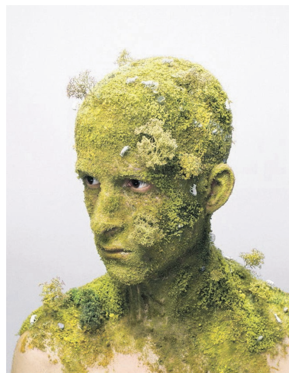
Levi van Veluw: Landscape I (2008).