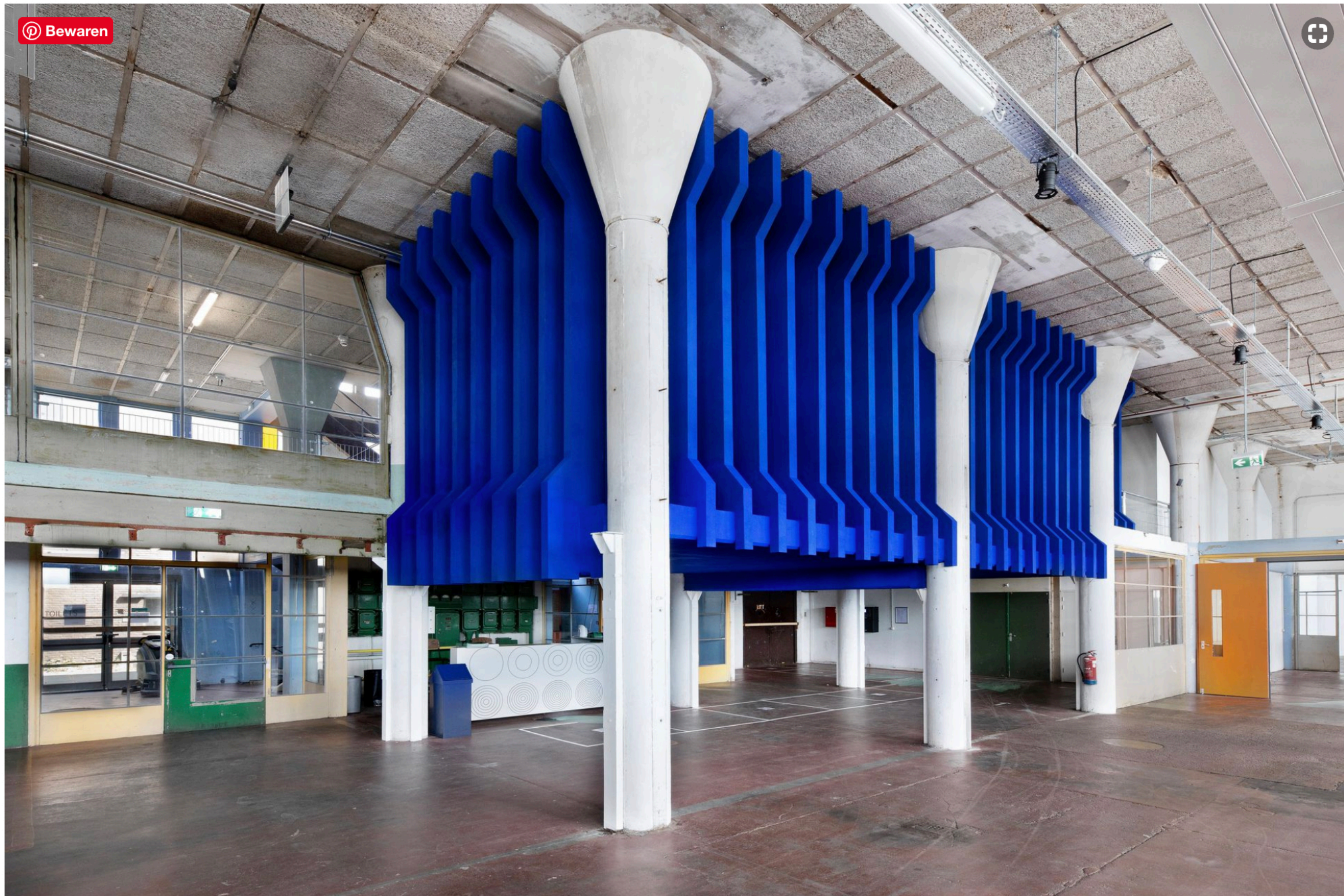
Sanctum van Levi van Veluw in Het Hem. Foto Levi van Veluw

Tentoonstelling De installatie 'Sanctum' van Levi van Veluw in Het HEM in Zaandam is als een kijkdoos waar je in kunt. Iets blauws dat het midden houdt tussen een grot en een kapel.